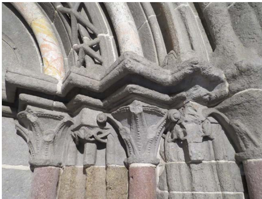
Obr. 6: Hlavice a rímasy južného (ľavého) ostenia románskeho portálu Kostola sv. Egidia v Ilji po reštaurovaní. Foto: autor, 2021.