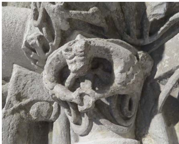
Obr. 8: Drače figúry na hlavici severného ostenia románskeho portálu Kostola sv. Egídia v Iľiji, pohľad spredu.

vice 13. storočia, prepoštského Kostola sv. Martina v Spišskej Kapitule a premonštrátskeho Kostola Panny Márie v Bíni. Bobule listov hlavíc hlavného západného portálu Kostola sv. Martina v Spišskej Kapitule 30 majú guľovitý tvar s rytým lemovaním v podobe vlnoviek a lístkov. Bobule prvej hlavice južného ostenia hlavného portálu Kostola Panny Márie v Bíni majú netradičný tvar, ktorý pozostáva z koncových postranných viaclaločných lístkov vytvárajúcich guľovitý tvar zvrchu obopínajúci strapiec hrozna. Hlavice v interiéri tohoto kostola nesú bohatý repertoár typov ukončenia listov v podobe dvojbobúľ, dvojšpirál, rolverkov.