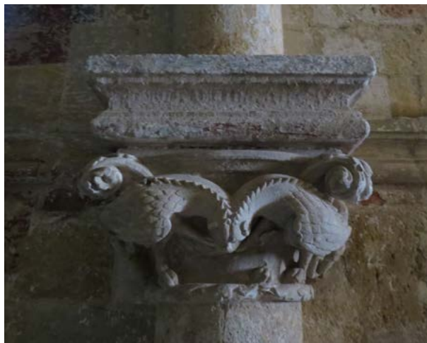
Obr. 11: Dračie figúry na hlavicí prípor v lodi Baziliky sv. Juraja v Jáku. Foto: autor, 2021.