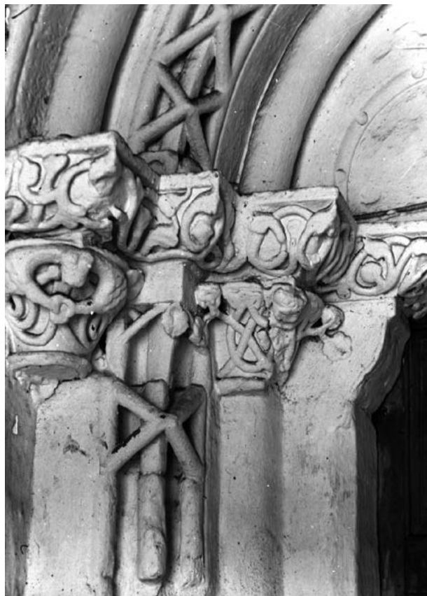
Obr. 4: Hlavice a rímky severného (pravého) ostenia románskeho portálu Kostola sv. Egídia v Iliji pred osekaním náterov. Foto: V. Mencl, 1930–1939. Archiv PÚ SR Bratislava, inv. č. D5763.

architektúra na Slovensku ho opisuje a hodnotí veľmi podrobne. 9 Všíma si profiláciu ústupkov s gotickým hruškovým prútom zachovanú už len v archivolte, ktorú odvodzuje od vplyvu benediktínskych stavieb z Třebíča, Jáku a Lébény. Pravé ostenie, tvary ríms a kalichovitých hlavíc stĺpov s bobuľovito ukončenými listami a diamantovaním pripisuje cisterciáskemu