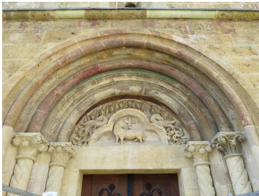
Obr. 12: Dračie figúry v tympanone južného portálu Baziliky sv. Juraja v Jáku. Foto: autor, 2021.

stĺpov oboch ostení výpravného západného portálu pôvodne benediktínskeho Kostola sv. Juraja v maďarskom Jáku (pred vysvätením kostola v roku 1256) 34 (obr. 10), ktorého dielňa sa dáva do priamej súvislosti s tvorbou ilijského portálu. Hoci svojimi zahnutými zobákmi pripomínajú dravých vtákov, na boku hláv majú v ploche vyryté dlhé vlnité dračie uši, a v literatúre sú označovaní ako draci. 35 Aj v interiéri jáckeho kostola, v západnej časti lode na stĺpe pripojenom k združenej prípoře, sa nachádzajú reliéfy tvorov so spoločnou hlavou a krídlami pokrytými perím, ktoré majú jednoznačnejší „dračí“ výzor a ich chvosty sa rozdeľujú na viacero častí prechádzajúcich do rastlinných úponkov s listami (obr. 11), podobne ako na portáli v Iliji. Naproti tomu reliéfnе spodobená vtákov, ktoré sa symbolicky radia k silám dobra, sú jednoznačne identifikovateľné svojím úzkym špicatým zobákom, hladkou modeláciou hlavy i tela, tenkými nohami, ako napr. na hlavici v lodi