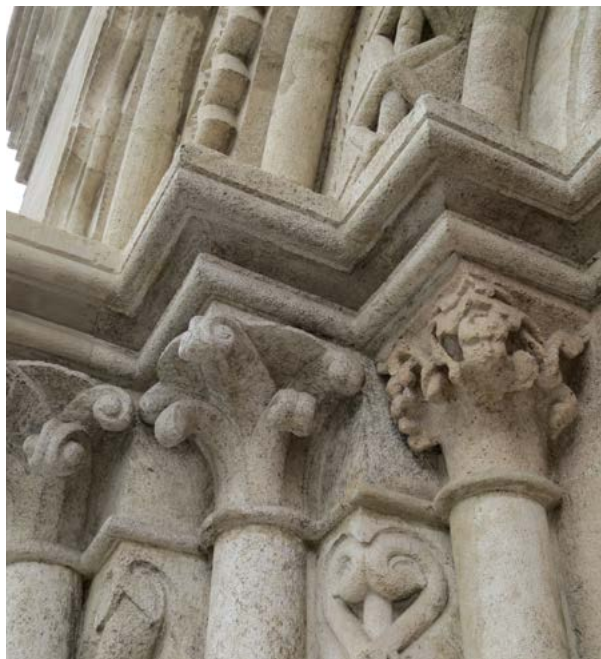
Obr. 18: Motív mužskej hlavičky hlavice západného ostenia južného portálu Dómu vo Viedenskom Novom Meste.

sv. Prokopa v Třebíči (obr. 16), na západnom portáli a tiež na hlavicích združených prípor pilierov lode kostola v Jáku (obr. 17). Tieto figurálne motívy sa hojne objavujú na i na spomínanom viedenskom Riesentor v podobe drobných mužských hlavičiek, vyvrbovačov i diabolských masiek, ako aj na južnom portáli neďalekého farského Kostola Liebfrauenkirche vo Viedenskom Novom Meste, a to na hlavici vnútorného stĺpika ľavého ostenia (obr. 18), aj na severovýchodnom portáli tzv. Gnadenportal (Milostivý portál) Dómu sv. Petra a sv. Juraja v Bambergu (koniec 12. stor. - začiatok 13. stor.), 54 ako aj na východnom ostení severného portálu Dómu sv. Petra vo Wormse, kde navyše bol použitý podobný stavebný materiál ako pri ilijskom portáli, tuf vo viacfarebných nuansiách – svetlookrovej na reliéfe hlavic, ríms a tympanóne v kombinácii s červenou na ostatných