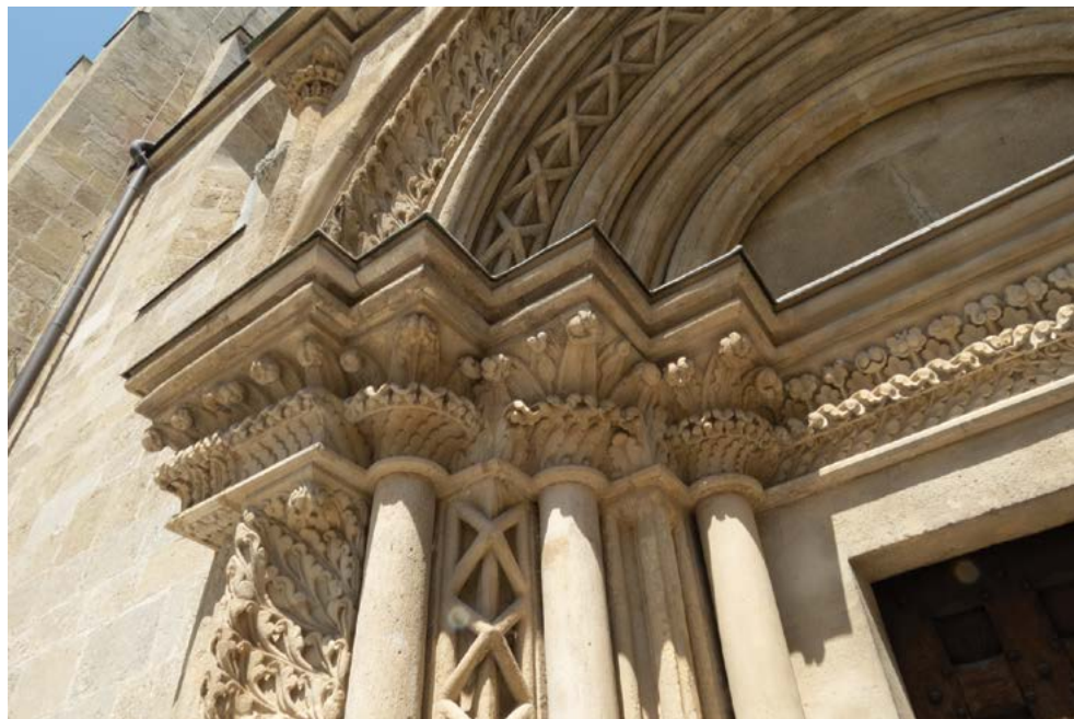
Obr. 20: Dekor cick-cak na južnom portáli Kostola sv. Jakuba st. v Lébény. Foto: autor, 2022.

vzor by tak mohol nadobúdať osobitnú symboliku, v kombinácii priamej „pozitívnej“ linky prekrývanej dvoma paralelnými lomenými „negatívnymi“ prútmí môže predstavovať neustále prebiehajúci boj dobra so zlom. Je charakteristickým prvkom portálov tzv. normanského štýlu. Nachádza sa v osteniach a archivoltách portálov, niekde i vo viacerých pásoch, napr. hlavného portálu Baziliky sv. Prokopa v Třebíči, portálu karnera sv. Pantaleóna v rakúskom Mödlingu (obr. 19), portálu karnera v Tullne, portálu tzv. Brauttor (Nevestina brána) farského kostola vo Viedenskom Novom Meste, južného portálu Kostola sv. Jakuba st. v maďarskom Lébény (obr. 20), hlavného portálu Kostola sv. Juraja v Jáku, portálov Kostola sv. Petra v Óriszentpéter a Kostola sv. Michala v Kéttornyúlak.