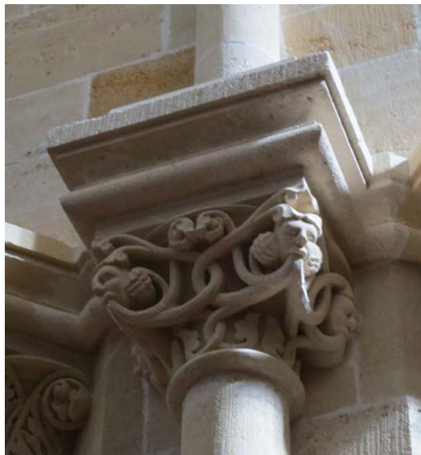
Obr. 17: Motív mužských hlavičiek na hlavici stĺpu severnej lode Baziliky sv. Juraja v Jáku. Foto: autor, 2021.