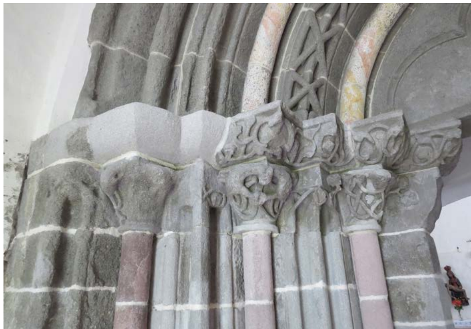
Obr. 5: Hlavice a rímasy severného ostenia románskeho portálu Kostola sv. Egídia v Ilji po reštaurovaní.

sochárskej zložky. 23 Pozorovaním a sondážou v murive pôvodnej západnej fasády bola potvrdená primárnosť románskeho portálu spolu s identifikovaním horizontálneho ukončenia rizalitu, ktorý obopínal lievikovito sa zužujúce ostenia portálu. Výskum spočíval aj v odobratí vzoriek omietok a mált s ich chemicko-technologickým rozborom, ktoré sa však po obnove v roku 1951 takmer vôbec nezachovali. 24 K čiastočným reštaurátorským zásahom na portáli