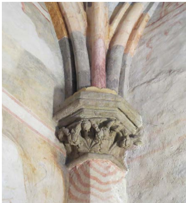
Obr. 16: Motív mužských hlavičiek na hlavici stĺpu severnej kaplnky v Bazilike sv. Prokopa v Třebíči. Foto: autor, 2021.

zvieracími tvármi. Dve menšie po stranách hlavice sú tzv. vyvrhovači , ktorým z otvorených úst vybiehajú časti rastlín 48 , stonka s päťlaločným listom. Väčšia hlavička uprostred hlavice pod nárožím kvadratického plintusu pôvodne s grotesknou grimasou, širokým úsľabkom, bola poškodená vertikálnou prasklinou hlavice, neskôr obnovená a reštaurovaná len náznakovo, takže nie je úplne jasné jej pôvodné vyznenie a prepojenie s okolím (obr. 15). Je možné, že na hlavičku primárne nadväzovala aj časť tela 49 , z ktorého po stranách vychádzali rastlinné úponky. Rozmiestnenie týchto troch hlavičiek akoby nahrádzalo bobuľovité ukončenia listov, ktoré tu