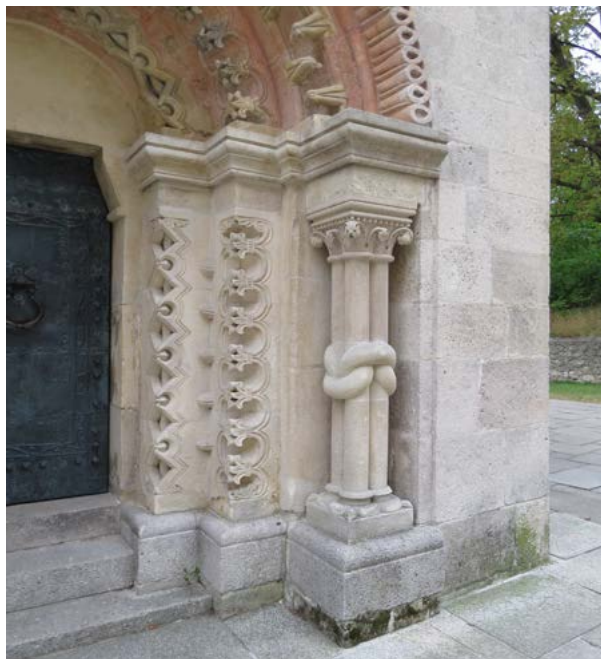
Obr. 19: Dekor cik-cak na portáli karnera sv. Pantaleóna v Mödlingu. Foto: autor, 2022.

Okrem sochársky stvárnených antropomorfných, zoomorfných a vegetatívnych motívov pokrývajú portál v Iliji aj ornamenty geometrických tvarov. Hladká plocha tympanónu je zvýraznená trojlaločným