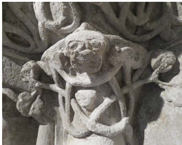
Obr. 15: Motív mužskej hlavičky na severnom ostení portálu Kostola sv. Egídia v Ilji.