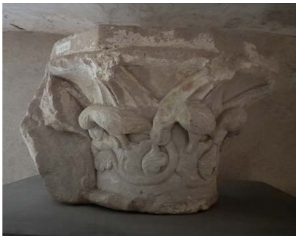
Obr. 9: Dračie figúry na hlavicí lapidária, Bazilika Nanebevzetí Panny Marie, sv. Cyrila a Metoděje na Velehrade, inv. č. 5819.