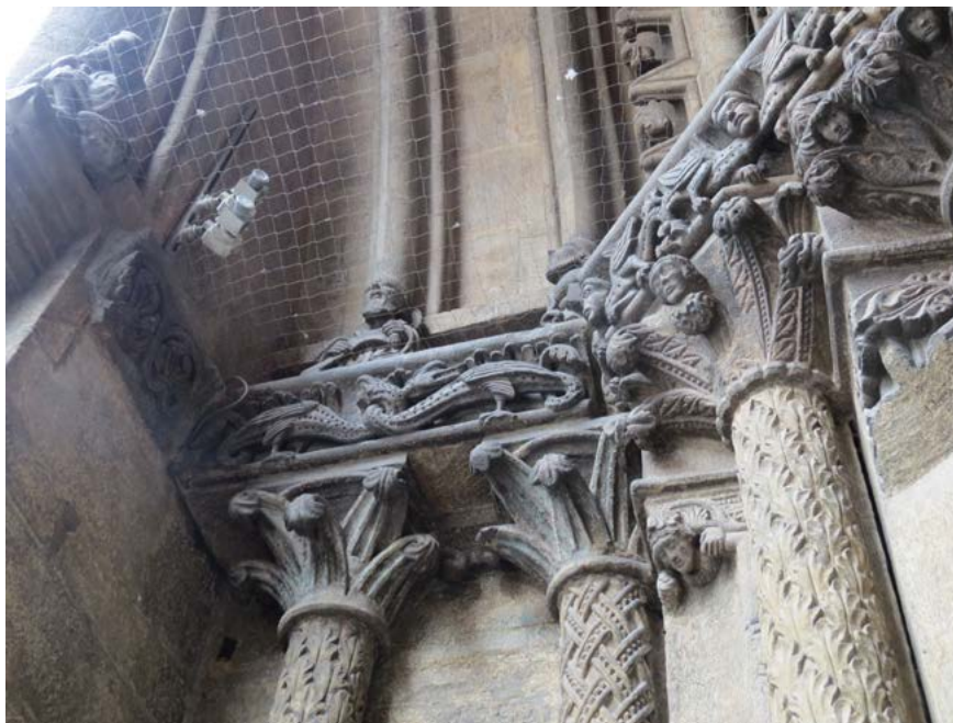
Obr. 13: Dračie figúry na rímse severného ostenia západného portálu Dómu sv. Štefana vo Viedni. Foto: autor, 2021.

oproti sebe stojace figúry 38 vtákov, levov, drakov, grifov, sfíng, chimér a iných bájných bytostí má svoj pôvod v starovekom umení Orientu a v období románskeho slohu je nezriedka súčasťou sochárskych kompozícií v rámci sakrálnych architektúr, napr. Saint-Gilles de Beauvais, Saint-Pierre de Chauvigny. 39