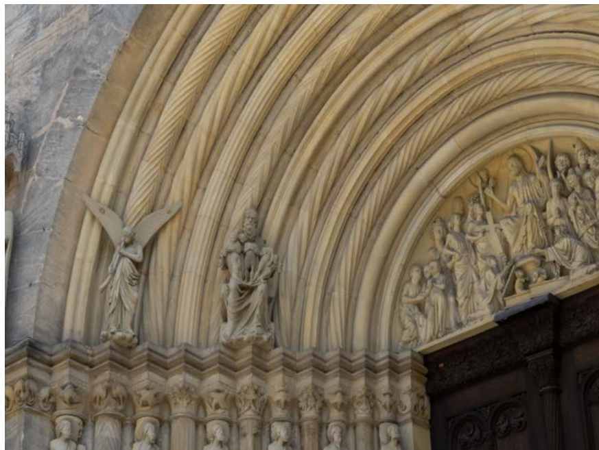
Obr. 14: Dračie figúry striedajúce reliéfy letiacich holubíc na hlaviciach západného ostenia južného portálu Dómu v Bambergu.

karnera sv. Jakuba v Soproni draci strážia po stranách strom života, 43 ich vyobrazenia sú i na reliéfoch v románskych kostoloch obcí Zsámbék, Ócsa a Karcsa. 44