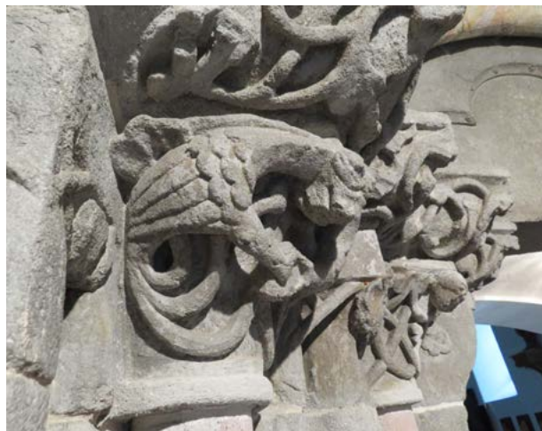
Obr. 7: Drača figúra na hlavici severného ostenia románskeho portálu Kostola sv. Egídia v Iľiji, bočný pohľad. Foto: autor, 2021.