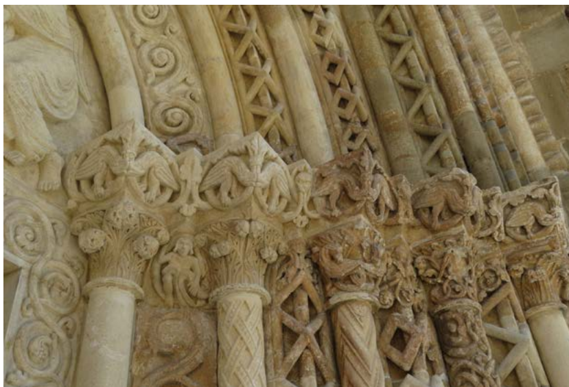
Obr. 10: Dračie figúry na osteniach západného portálu Baziliky sv. Juraja v Jáku.

najbližších „dračích“ reliéfov hlavic prípor a svorníkov z kláštorného ambitu pri románskej bazilike na Velehrade, pochádzajúcich z obdobia prvej polovice 13. storočia a dnes uložených v podzemnom lapidáriu. 33 Obvod kalichovitých hlavic s jazykovitými listami tu lemuje reliéfny vlys v podobe drakov, na hlave so špicatými ušami a širokými tlamami vzájomne si zakusujúcich do koreňov chvostov, ktoré sa volutovito stáčajú a na konci ich ukončujú laloč-